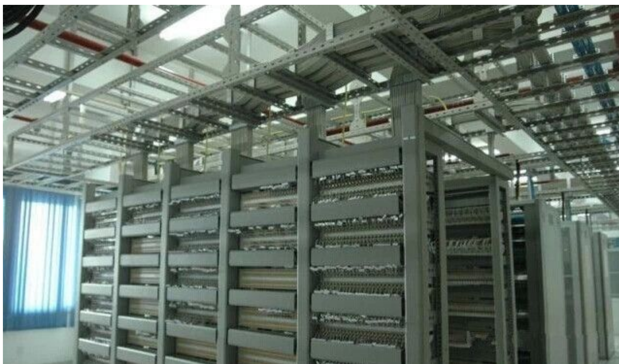
图 23 美观是绝对的