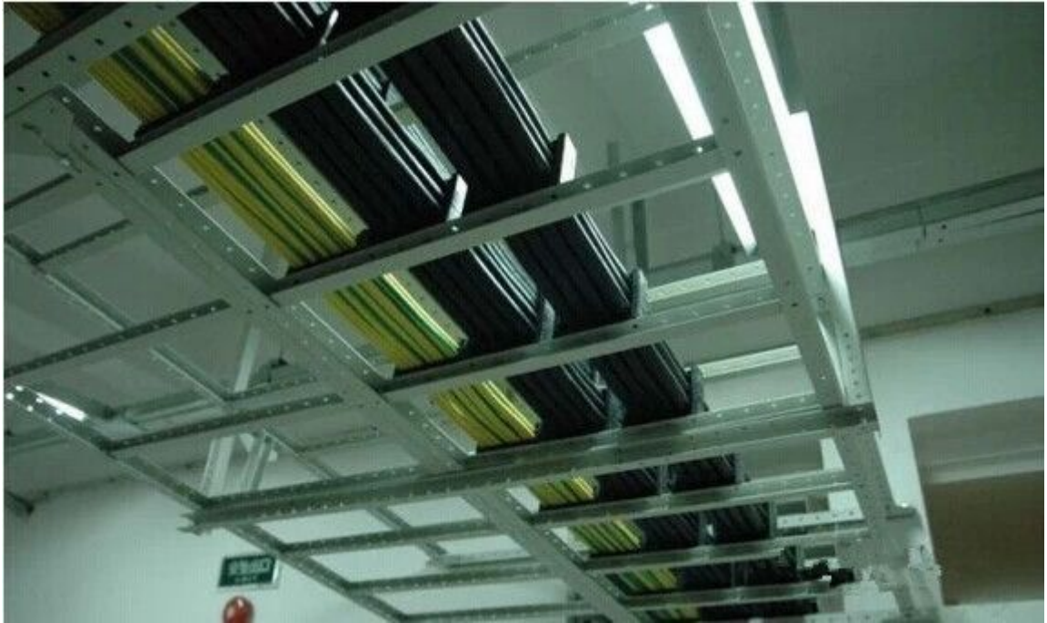
图 31 这几根够粗