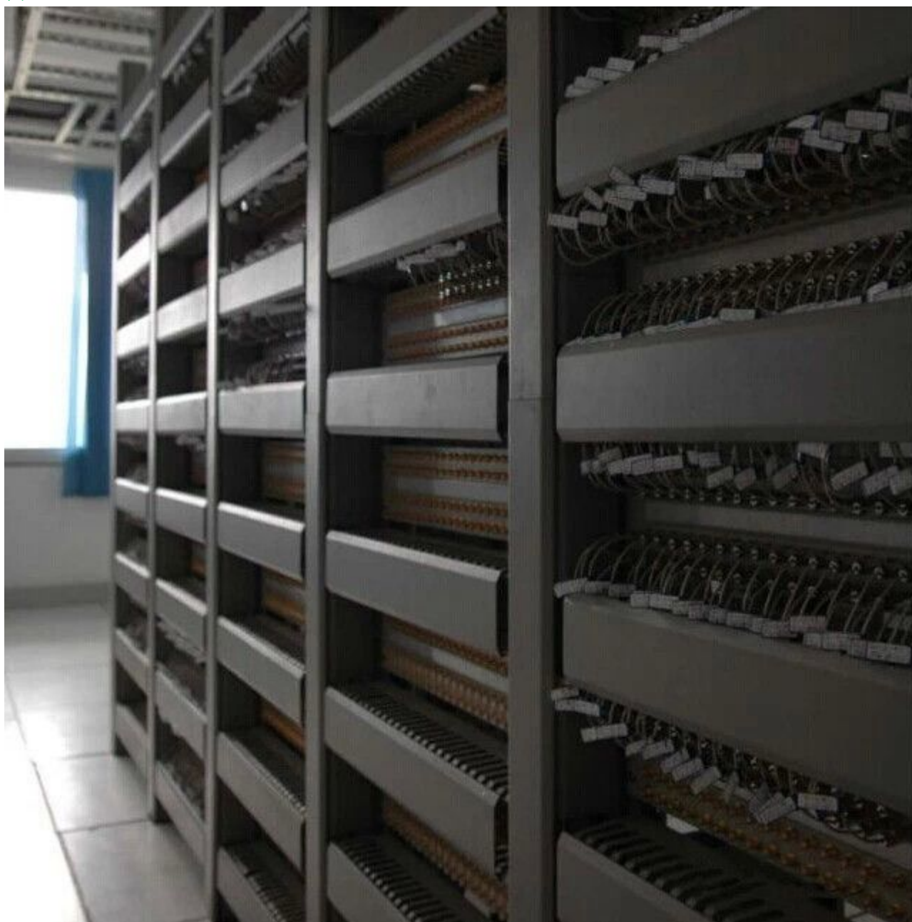
图 1 一线一签，便于查找

为什么我们的机房像蛛网一样令人难以理清头绪？什么样的才是标准化机房？这是个问题。不过，这个问题即将成为历史，今天就来带大家看一看真正的标准化机房。你还在为面对机房里“错综复杂”的 线缆 苦恼么？你还在为找不到故障点而欲哭无泪么？快来看看人家的机房是怎么布置的吧。真正的标准化机房，解决运维人员的烦恼！