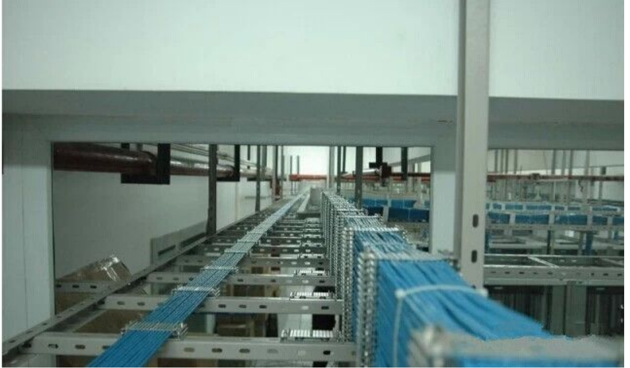
图 2 精致、规整的布线