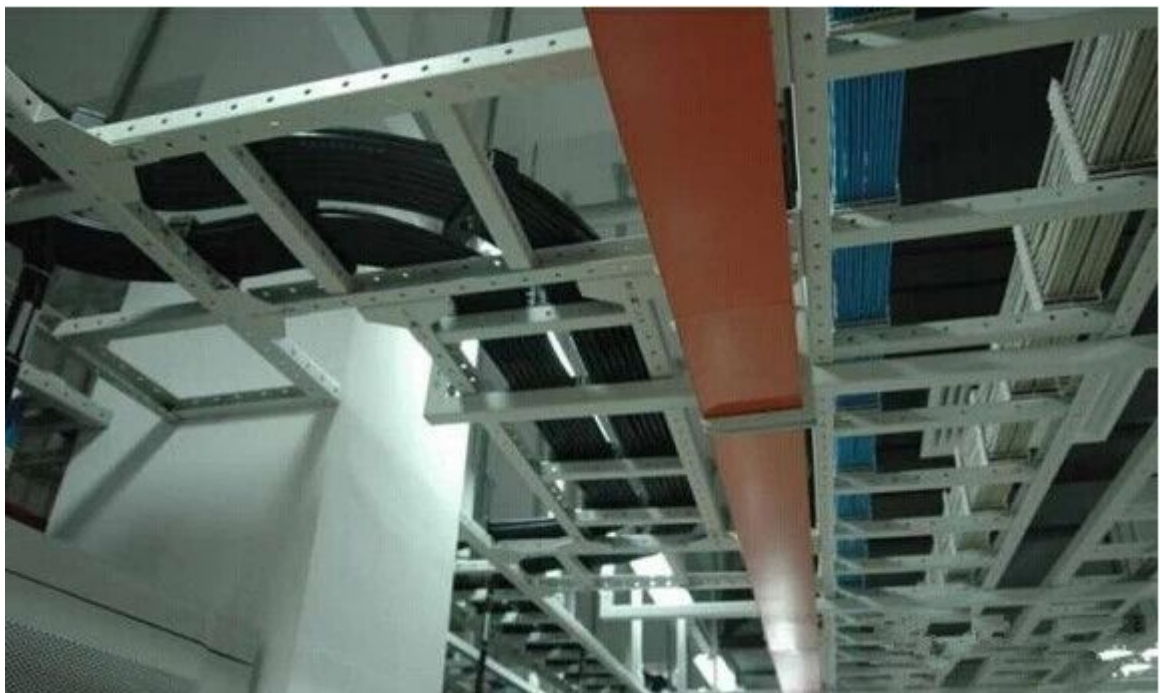
图 35 何时所有的机房才能都如此