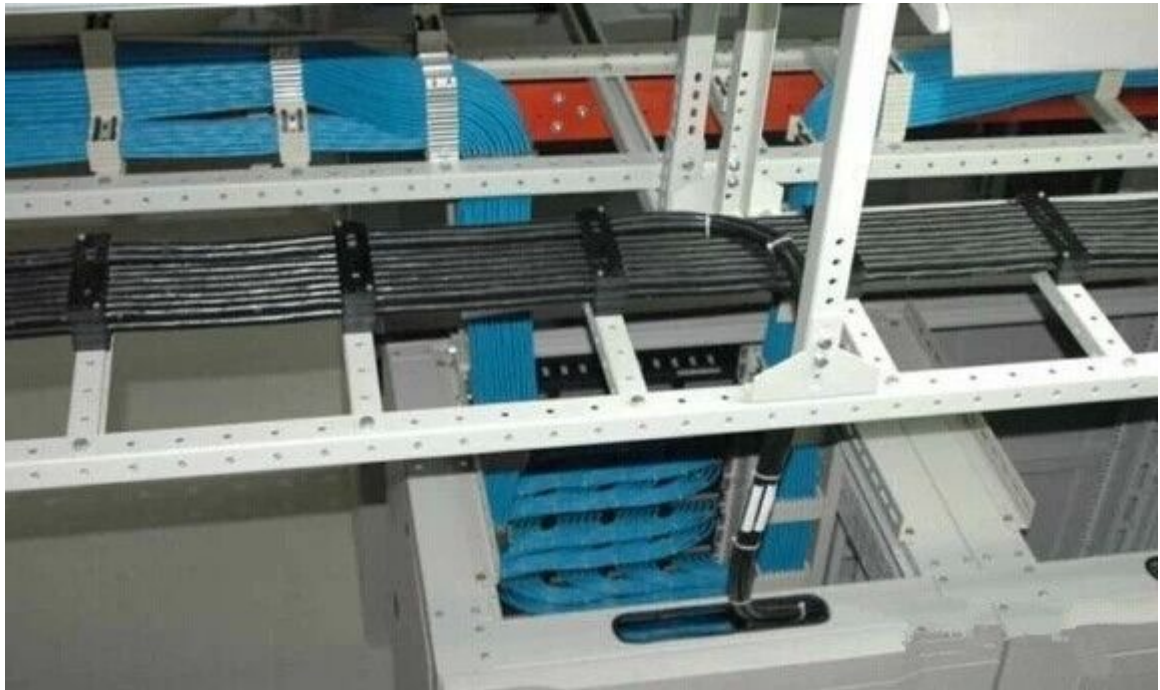
图 34 又见“中国结”