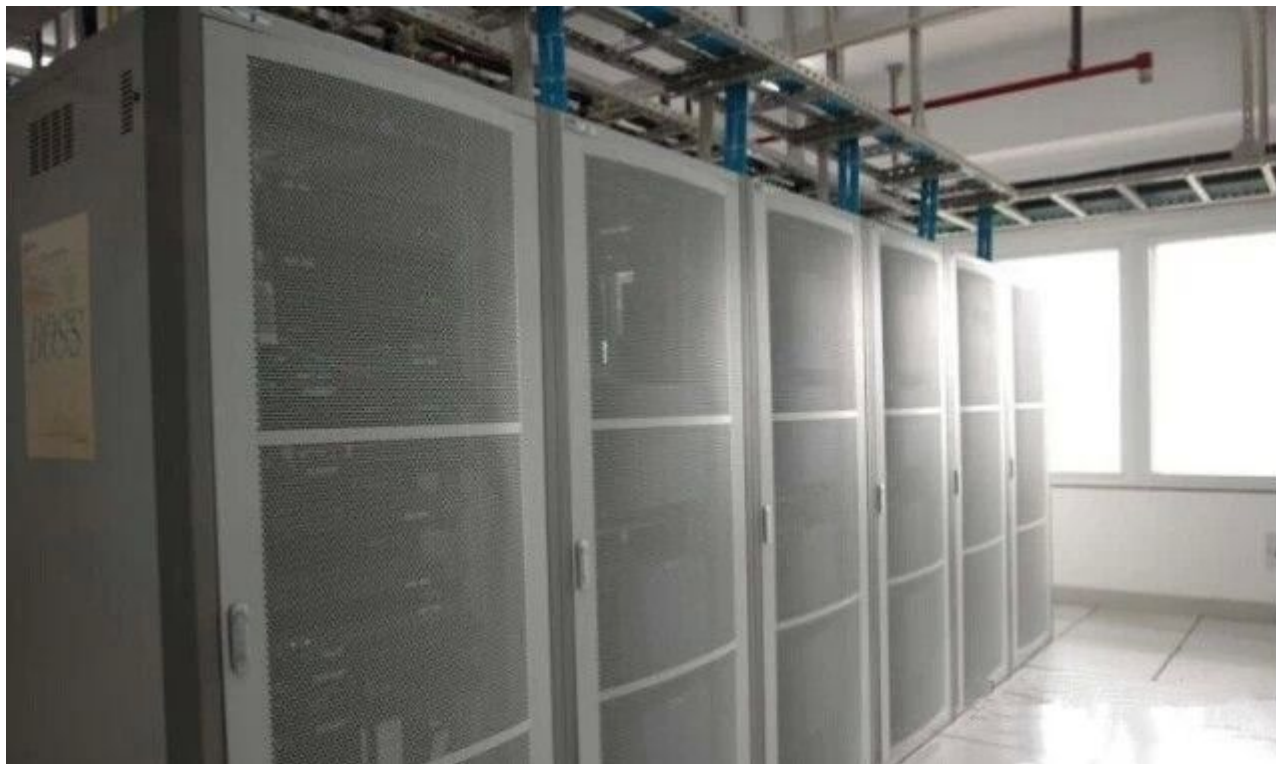
图 22 特写二