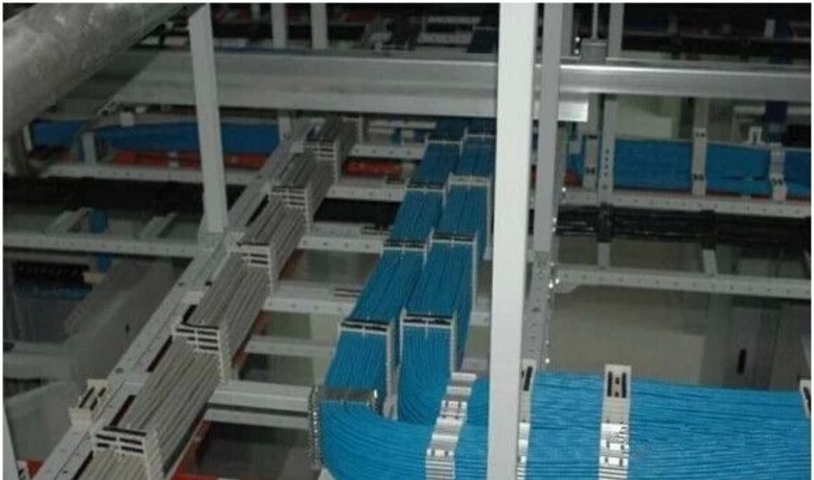
图 32 真想问问他们是怎么理清这些线的