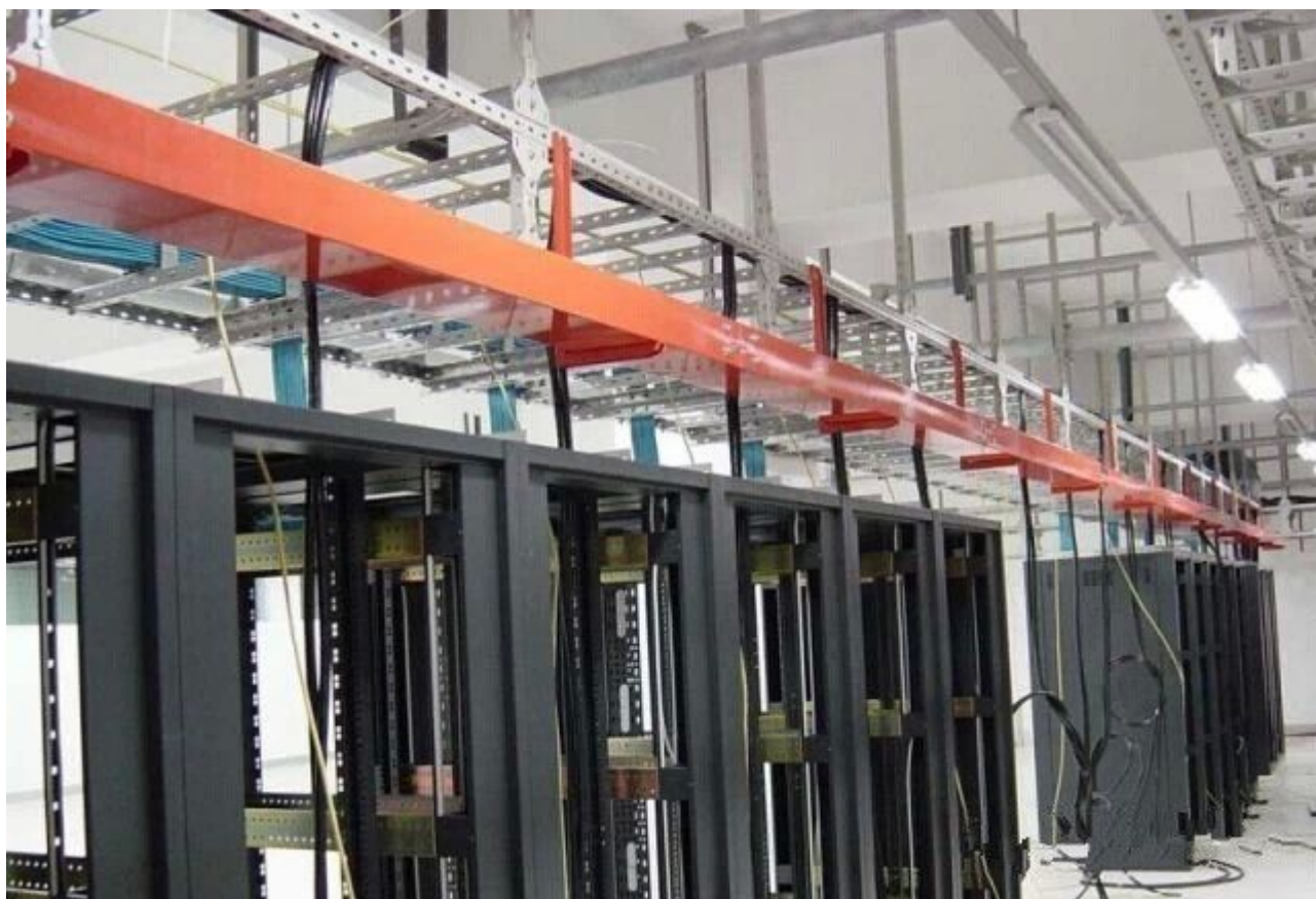
图 20 特写一张