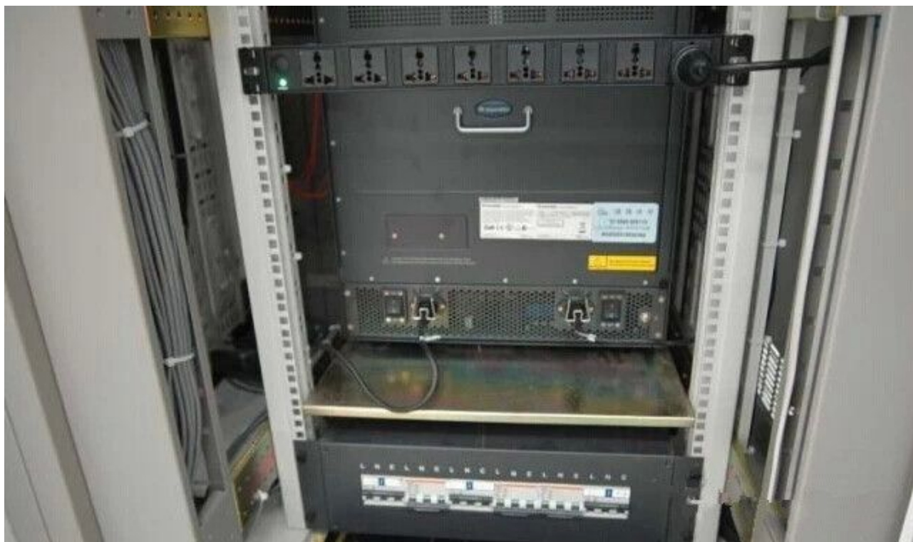
图 26 不知道这里插满了插头之后是否还会如此整洁