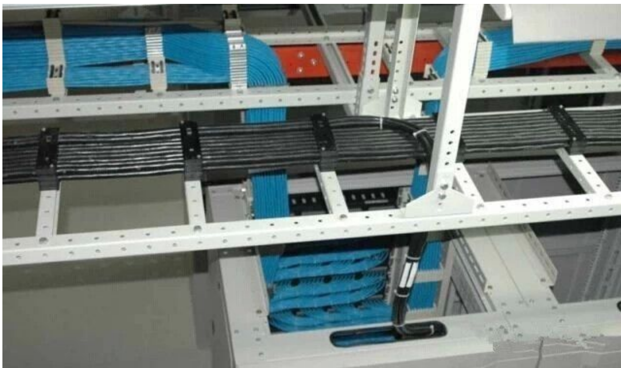
图 24 看起来像中国结