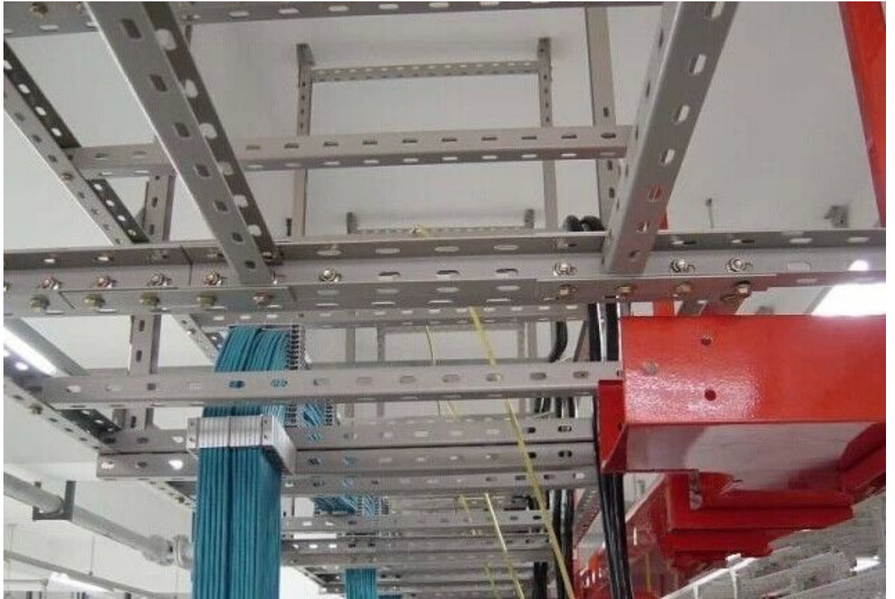
图 19 飞流直下三千尺，原是网线落九天