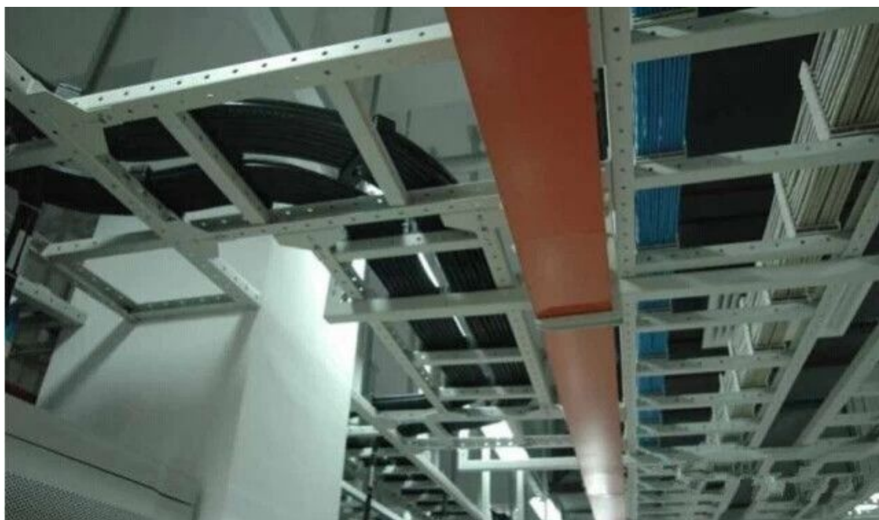
图 25 完美的曲线