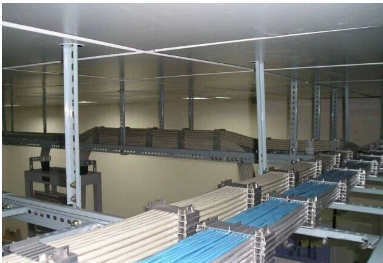
图 29 并行不悖，如此而已