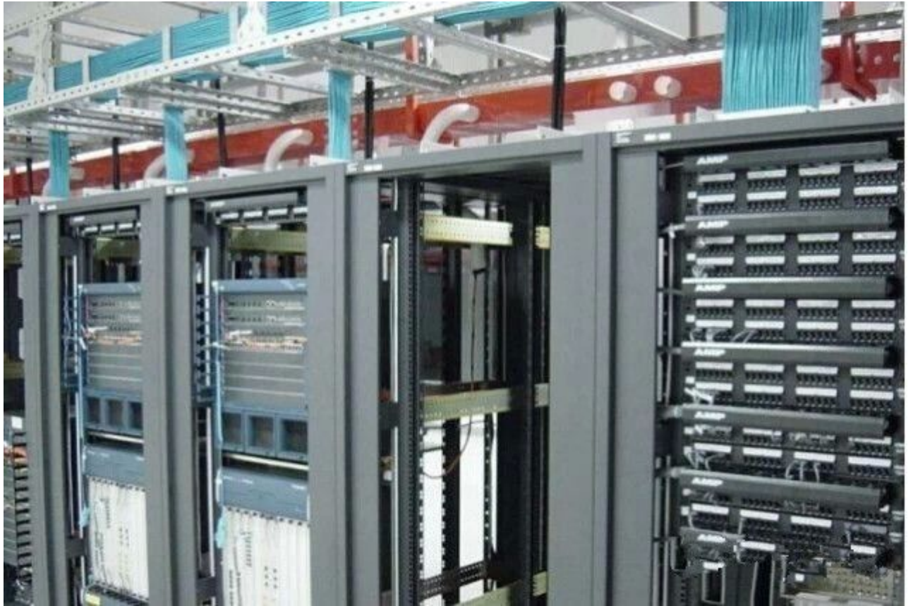
图 28 又见几位牛人